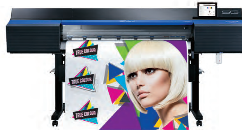
SG-540 (1.371 mm breit)

Ob Sie nun ein neu gegründetes Unternehmen sind oder Ihre Produktion ausweiten möchten: Die TrueVIS SG-Serie hilft Ihnen, Ihre Ziele zu verwirklichen.