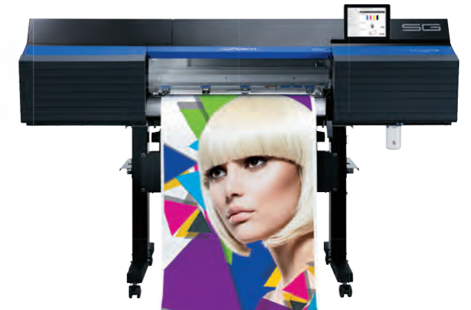
SG-300 (762 mm breit)